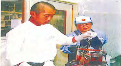
金メッキ体験を志す中学生

した後、金を溶かし込んだめっき液の中に入れた。電気を流すと、みるみるうちにアクセサリーの表面が金色に変化。「すごい、すごい」と歓声を上げた。