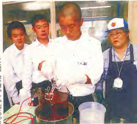
金めっき処理を体験する生徒たち

した後、金を溶かし込んだめっき液の中に入れた。電気を流すと、みるみるうちにアクセサリーの表面が金色に変化。「すごい、すごい」と歓声を上げた。